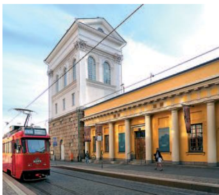
Rahamuseo sijaitsee osoitteessa Snellmaninkatu 2, Senaatintorin kulmassa keltaisessa rakennuksessa. Museon sisustuksen on suunnitellut Juhani Pallasmaa, jonka käsialaa on myös Inarin Sii-da-museo.

näyttelyissä vain kullattuja kopioita. Hippujäljennökset pystyvät antamaan vain summittaisen kuvan alkuperäisestä koosta ja muodosta. Pinnan pienrakenteet ja hippukullan värin vivahteet eivät jäljennöksissä toistu oikeastaan lainkaan. Kopioista puuttuu aidon hipun henki.