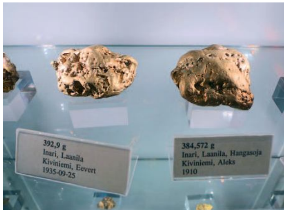
Lapin isoimmat hiput ovat niin samankokoisia, että ne voisivat kumpikin ansaita ykköspaikan. Kuvassa hippujen kullatut kopiot GTK:n Geonäyttelyn hippuvitriinissä.

Mielestäni on kunnioitettavaa, että ainakin yksi kaikkein suurimmista Lapin hipuisista on pysyvästi ihmisten tarkasteltavissa. Semminkin kun tänä vuonna on Aleksihipun löytymisen satavuotispäivä. Rahamuseoon ei edes ole pääsymaksua. Vitriinissä hippua voi tarkastella aivan lähietäisyydeltä ja kohdevalot sopivat jopa sen valokuvaimiseen. Muut isomukset ovat visusti pankkiholveissa ja vastaavissa paikoissa. Niistä on