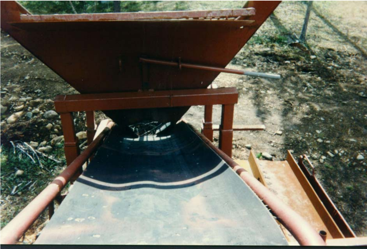
Seula ja kuljetushihna