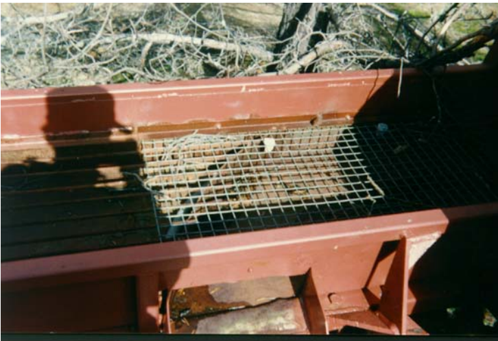
Siirtoränni koneen takana