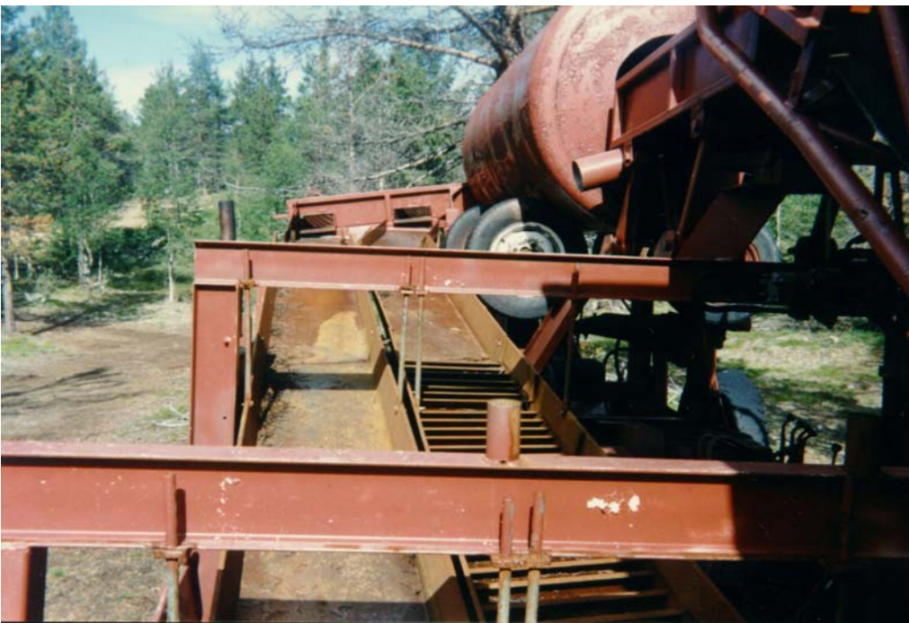
Kaksi ränniä ja rihlat