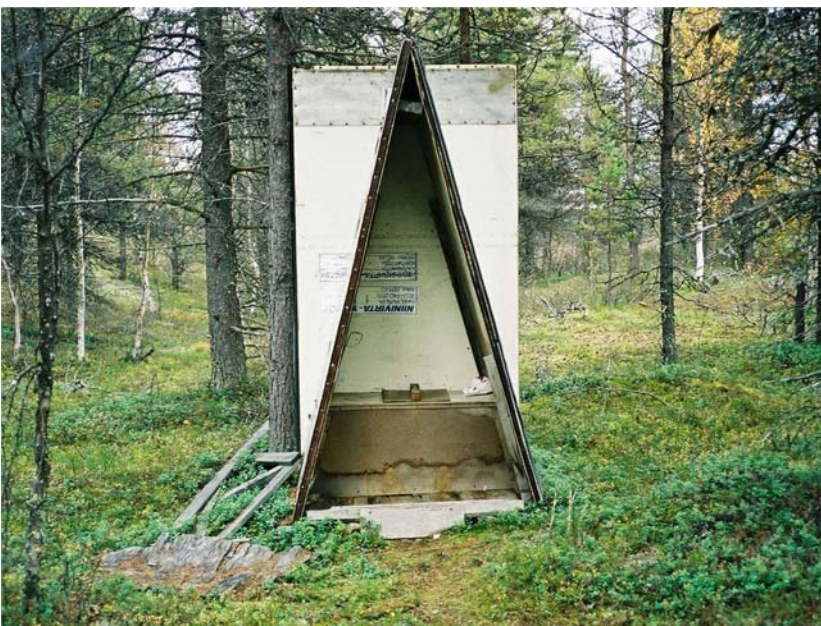
Nevalan komia vessa 2001