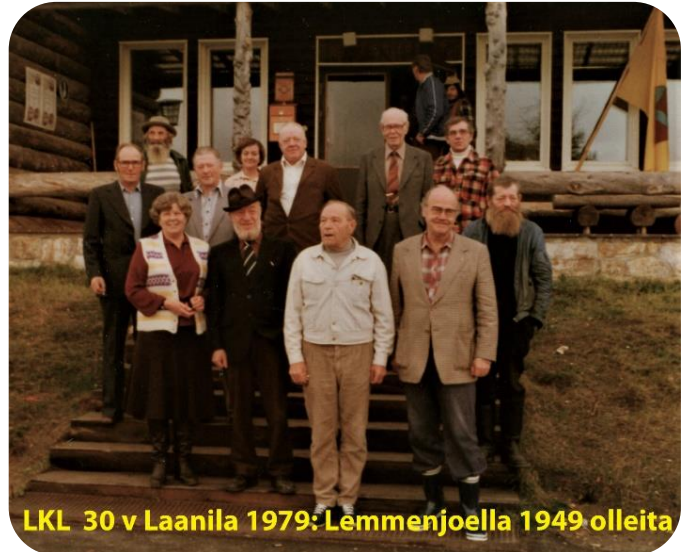
LKL 30 v Laanila 1979: Lemmenjoella 1949 olleita

Lapin kullankaivulle luotiin pohja ja suunta 150 vuotta sitten. Ensimmäiset yksittäiset kullankaivajat marssivat Lapin kultakentille 1869, tehtiin lait ja asetukset, luotiin byrokratia, taisteltiin venäläisten kanssa. Vuosi 2019 on Lapin kullankaivajan juhluvuosi toisestakin syystä. 70 vuotta sitten 1949 perustettiin Lapin Kullankaivajain liitto.