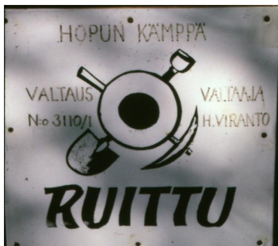
Hopun kämppäni ovikyltti