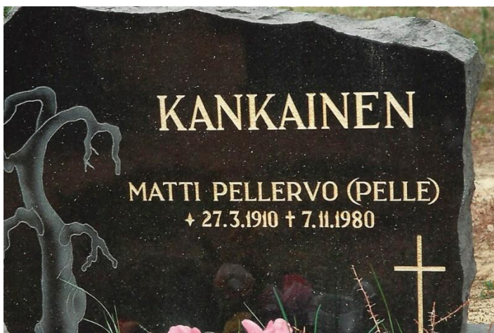
Pyrkyrien palstalla.