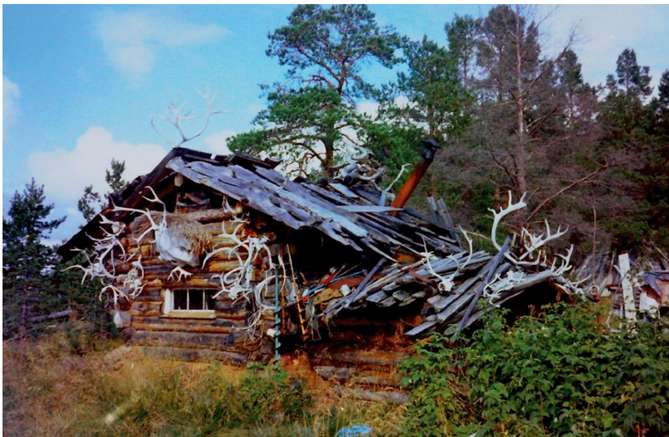
Pellenniemen Kalakoti Mudduksella. Kirjailija Hans Lidman nimesi sen Satupirtiksi.

Kirjailija Hans Lidman kävi siellä Pellen vieraana 1966 ja kertoo ”Pohjoiskalotin ihmisiä” -kirjassaan käynnistään Satupirtillä niin kuin hän kämppää kutsuu, mikä kuvasti hänen tuntemuksiaan miljööstä. Satupirtti-nimitys vakiintuikin yleiseen käyttöön.